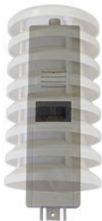
Questa è il sensore di temperatura ed umidità che include il trasmettitore dell'indicatore.