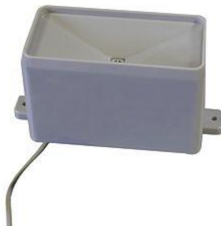
Qui vedi il sensore di pluviometria dell'indicatore meteorologico FSW 20