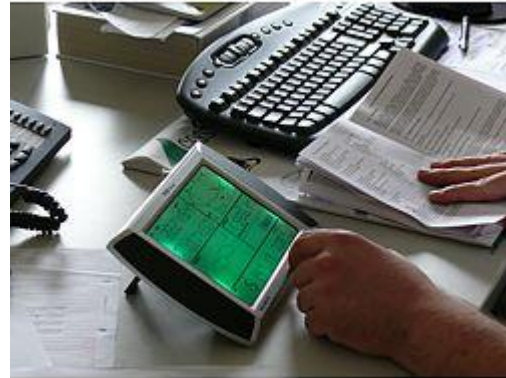
Qui vedi l'uso dell'indicatore meteorologico FSW 20 attraverso lo schermo tattile