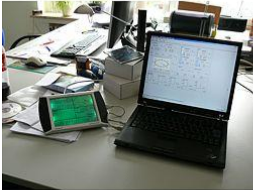
Qui osserva l'indicatore meteorologico FSW 20 connesso ad un portatile col software