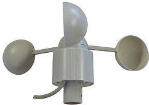
Questo è il sensore di velocità dell'aria dell'indicatore meteorologico FSW 20