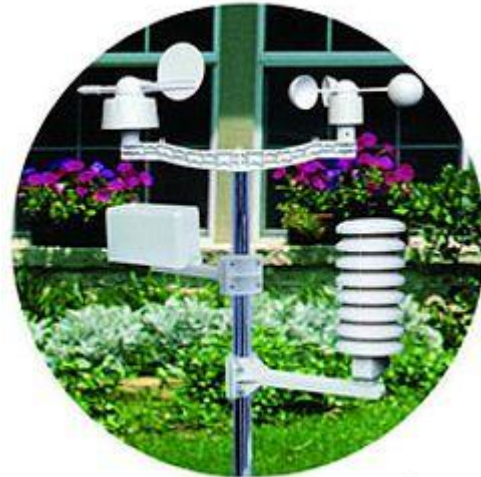
Qui può vedere i sensori attaccati all'asta che si include nella spedizione dell'indicatore.