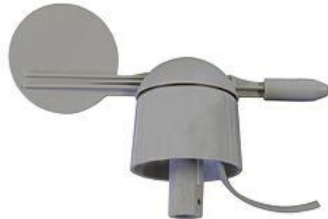
Questo è il sensore di direzione del vento dell'indicatore meteorologico FSW 20